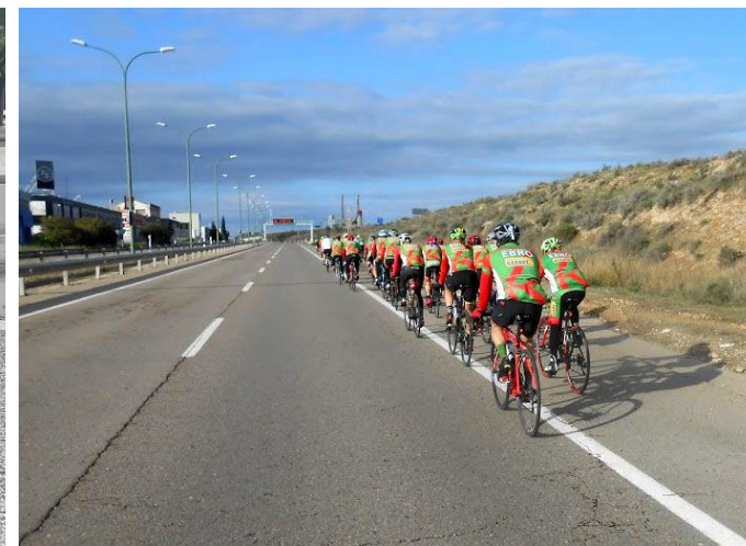
Alberto Sáenz nos fotografió para la foto del Club y en perfecta formación por carretera, esta vez en dirección a