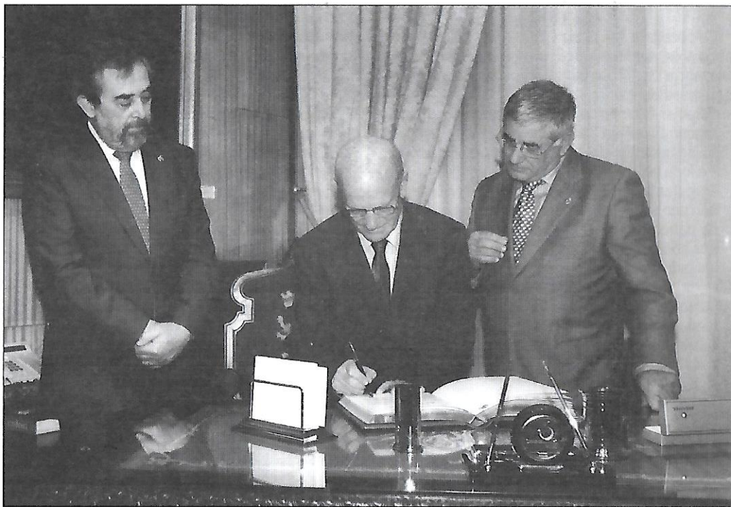
Entrega de los Premios del Deporte Ciudad de Zaragoza 2008